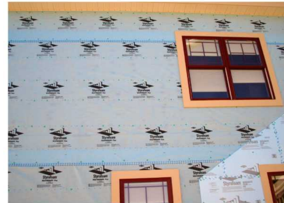
上下重ねシロの施工状態